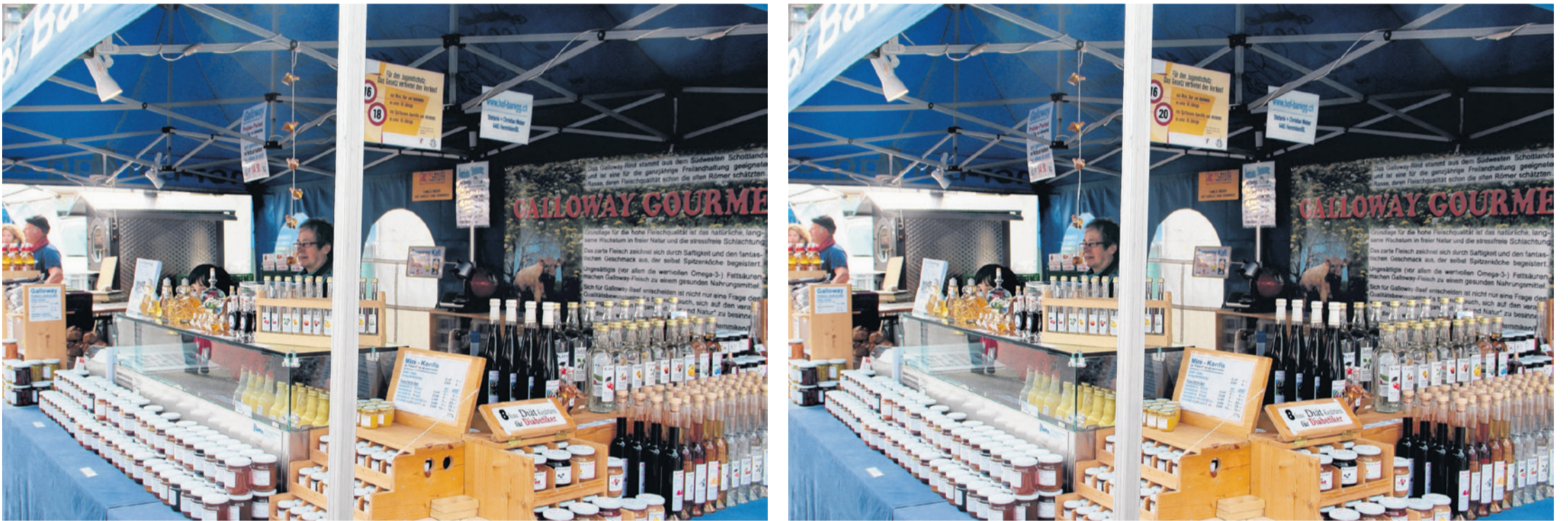
Ein Stand auf dem Gelterkinder Herbstmarkt.

FINDEN SIE DIE SIEBEN UNTERSCHIEDE, DIE IN DEN BEIDEN BILDERN VERSTECKT SIND.