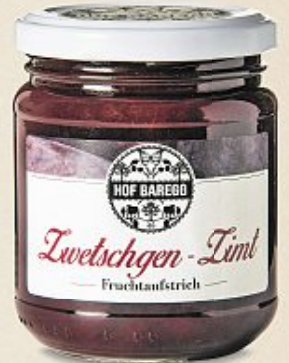
Hof Baregg Zwetschgen-Zimt Fruchtaufstrich, 250 g (100 g = 2.60)