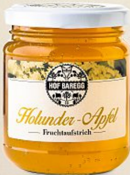
Hof Baregg Holunder-Apfel Fruchtaufstrich, 235 g (100 g = 2.96)