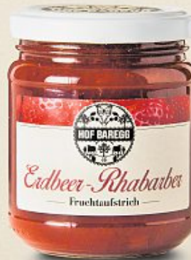
Hof Baregg Erdbeer-Rhabarber Fruchtaufstrich, 230 g (100 g = 3.70)