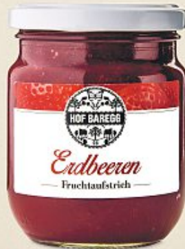
Hof Baregg Erdbeeren Fruchtaufstrich, 235 g (100 g = 3.39)