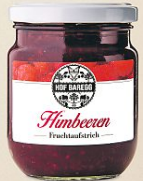
Hof Baregg Himbeeren Fruchtaufstrich, 235 g (100 g = 3.62)